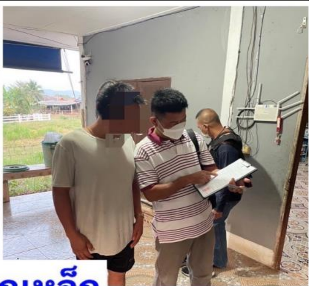
สภ.มวกเหล็ก